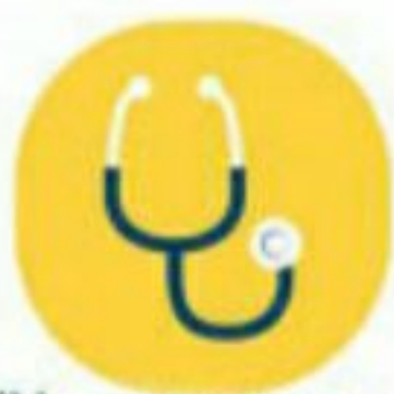
در صورت بروز علائم مراقبت های پزشکی را انجام دهید