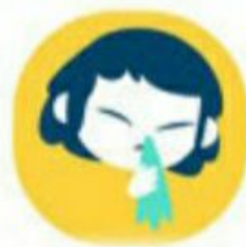
هنگام سرفه دهان و بینی را بپوشانید