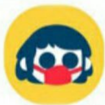
استفاده از ماسک