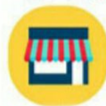
از رفتن به اماکن شلوغ خودداری کنید