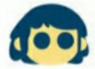
تماس با انسان