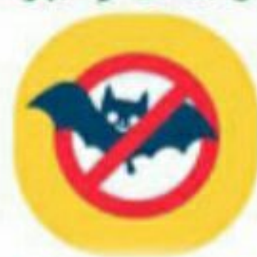
از تماس با حیوانات خودداری کنید