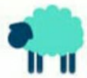
تماس با حیوانات